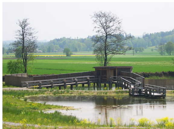
Hide bei der Naturstation Silberweide